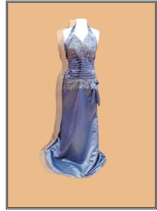
شكل رقم (٥)

شكل ٥ فستان من الستان البنفسجي الفاتح بكسرات أسفل الصدر منتهية بدانتييل شكل ٦ فستان من الدانتييل البنفسجي الفاتح، بقصة من الستان الأسود من على الصدر، ونهاية الفستان من الخلف من