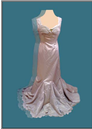
شكل رقم (٢)

شكل ١ فستان من الأورجانزا بكسرات من أعلى وطبقات بكشكشة من أسفل الأرداف شكل ٢ فستان من الستان والدانتيل بدرايبهات منتظمة من على الصدر واتساع من أسفل على شكل جوديبهات