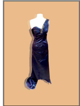
شكل رقم (٤) أمام

شكل ٤ أمام فستان من الستان الأزرق بدرابيهات على الصدر من الجهة اليمنى وحماله على الجهة اليسرى فقط شكل ٤ خلف نفس الفستان والخلف أطول من الأمام قليلا، بحماله دانتييل من الجهة اليسرى، منتهية بقصة عند خط الوسط