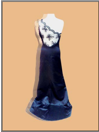
شكل رقم (٤) خلف

شكل ٤ أمام فستان من الستان الأزرق بدرابيهات على الصدر من الجهة اليمنى وحماله على الجهة اليسرى فقط شكل ٤ خلف نفس الفستان والخلف أطول من الأمام قليلا، بحماله دانتييل من الجهة اليسرى، منتهية بقصة عند خط الوسط