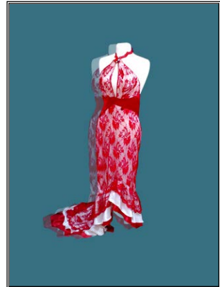
شكل رقم (٣) أمام

شكل ٣ أمام فستان من الدانتيل ببطانة من الستان الأبيض بحزام من على الوسط وطبقات بكشكشة من أسفل بخطوط مائلة شكل ٣ خلف نفس الفستان والخلف أطول