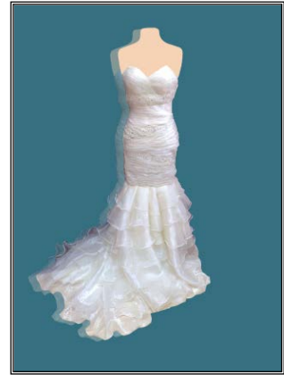
شكل رقم (١)

شكل ١ فستان من الأورجانزا بكسرات من أعلى وطبقات بكشكشة من أسفل الأرداف شكل ٢ فستان من الستان والدانتيل بدرايبهات منتظمة من على الصدر واتساع من أسفل على شكل جوديبهات