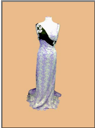
شكل رقم (٦)

شكل ٥ فستان من الستان البنفسجي الفاتح بكسرات أسفل الصدر منتهية بدانتييل شكل ٦ فستان من الدانتييل البنفسجي الفاتح، بقصة من الستان الأسود من على الصدر، ونهاية الفستان من الخلف من